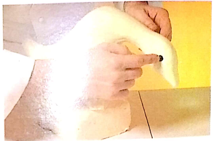
4 - Διακοσμούμε τη βάση και προσθέτουμε τα πόδια και τα μάτια.