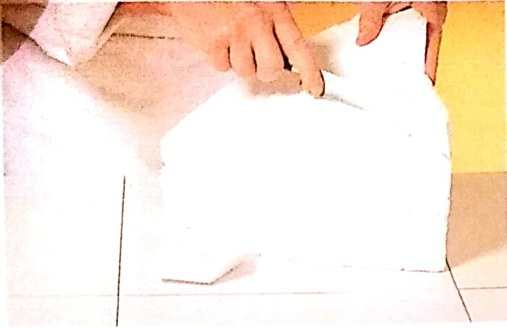
1 - Δίνουμε ένα γενικό σχήμα χήνας σ' ένα κομμάτι felizól.