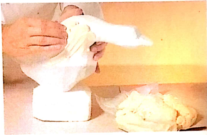
3 - Καλύπτουμε με μαργαρίνη, αρχίζοντας από το σώμα. Τελειώνουμε με τη βάση.