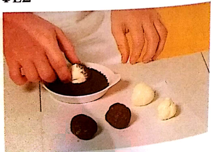
2 - Τις βουτάμε σε καφέ.