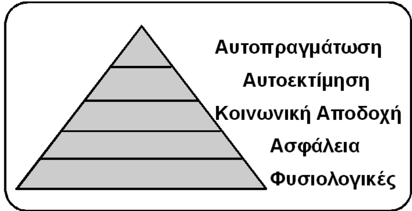
Η πυραμίδα των αναγκών (Μάσλοου)