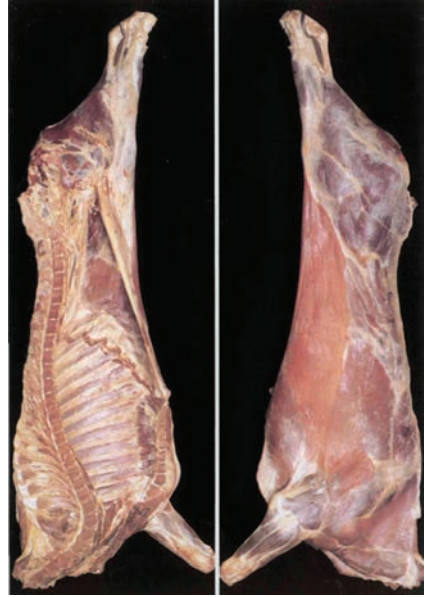
1 (Πολύ μικρή)