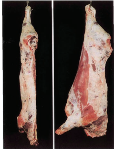
O (Αρκετά καλή)