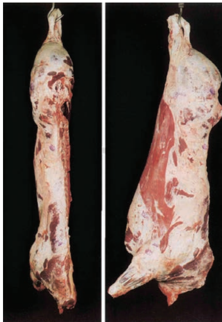
U (Πολύ καλή)