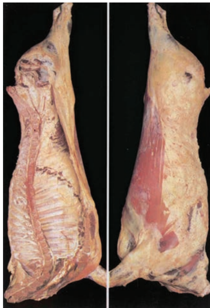
5 (Πολύ μεγάλη)