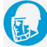
Υποχρεωτική προστασία του προσώπου