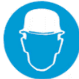
Υποχρεωτική προστασία του κεφαλιού