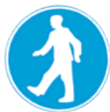
Υποχρεωτική διάβαση για πεζούς