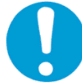
Γενική υποχρέωση (συνοδευόμενη ενδεχομένως από πρόσθετη πινακίδα)