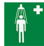
Θάλαμος καταιωνισμού ασφαλείας