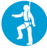
Υποχρεωτική ατομική προστασία έναντι πτώσεων