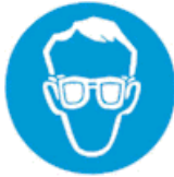
Υποχρεωτική προστασία των ματιών