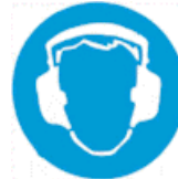
Υποχρεωτική προστασία των αυτιών