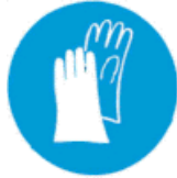
Υποχρεωτική προστασία των χεριών