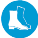
Υποχρεωτική προστασία των ποδιών