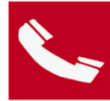
Τηλέφωνο για την καταπολέμηση πυρκαγιών