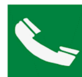
Τηλέφωνο για διάσωση και πρώτες βοήθειες