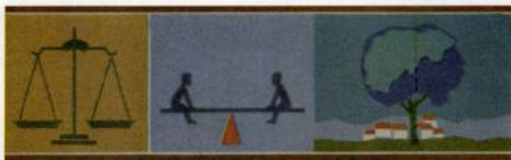
Εικόνα 29α. - Συμμετρική ισορροπία όγκων.