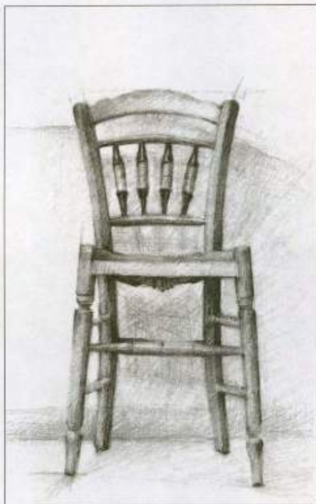
Εικόνα 26α. - Σχέδιο καρέκλας, μολύβι

Σε περίπτωση που τη βλέπουμε μετωπικά, την τοποθετούμε στη μέση της σχεδιαστικής επιφάνειας και λίγο πιο κάτω από το κέντρο, ώστε να μείνει περισσότερο κενό πάνω παρά κάτω και να φαίνεται ότι η καρέκλα στέκεται στο δάπεδο και όχι στον αέρα. Η στήριξη των αντικειμένων είναι ένα σημαντικό στοιχείο, που δεν πρέπει να παραβλέπεται.