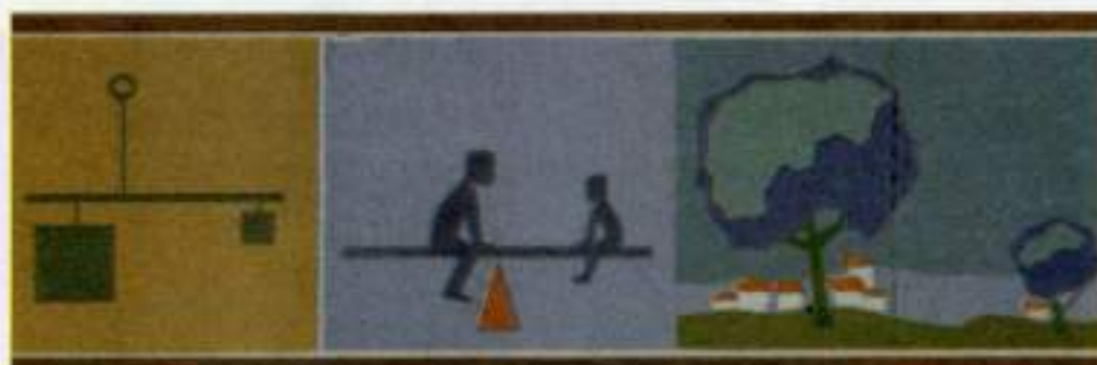
Εικόνα 29β. - Ασύμμετρη ισορροπία όγκων.