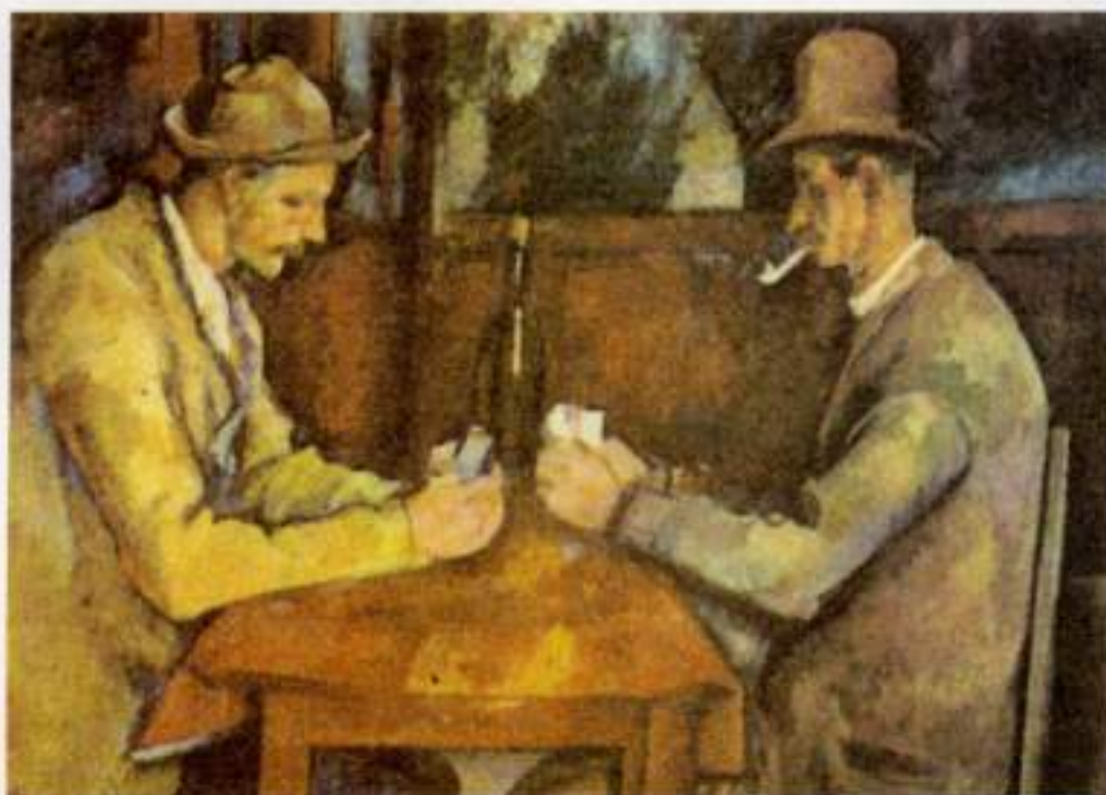
Εικόνα 28. - Π. Σεζάν, «Οι χαρτοπαίχτες»

Το μεγάλο πρόβλημα παρουσιάζεται στην ασύμμετρη ισορροπία, όπου τα άνισα βάρη τοποθετούνται και σε άνιση απόσταση από τον κεντρικό άξονα. Στην περίπτωση δύο τέτοιων όγκων τοποθετούμε το μικρό "βάρος" μακριά από τον κεντρικό άξονα και λίγο προς τη μια άκρη του χαρτιού, ενώ το μεγάλο "βάρος" κοντά στον κεντρικό άξονα, ο οποίος μπορεί, και αυτός, να έχει ελαφρά μετακινηθεί προς την άλλη άκρη.