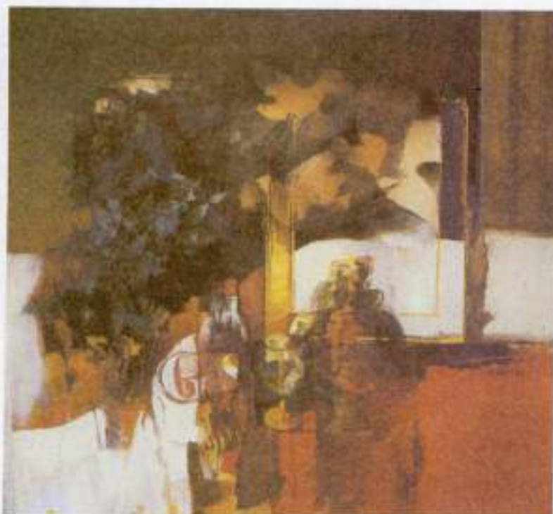
Εικόνα 25. - Α. Απίτζης «Σύνθεση» (λεπτομέρεια)

Εάν, για παράδειγμα, έχουμε μία σύνθεση αντικειμένων πάνω σε ένα τραπέζι όπως στην εικόνα 25, θα σχεδιάσουμε στο κάτω μέρος της σχεδιαστικής επιφάνειας ένα τμήμα του τραπεζιού και πάνω σ' αυτό τα αντικείμενα. Πάνω από το υψηλότερο αντικείμενο αφήνουμε ένα εύλογο κενό, για να αναπνέει η σύνθεση. Αυτό το κενό δεν πρέπει να είναι τεράστιο και να πνίγει τα αντικείμενα ούτε και ελάχιστο με κίνδυνο να ακουμπήσει κάποιο από αυτά στα όρια του χαρτιού. Το ίδιο συμβαίνει και στα πλάγια. Γκριζάροντας δε τα αντικείμενα μαζί με το τραπέζι, πρέπει η συνολική επιφάνειά τους να είναι ανάλογη με τον περιβάλλοντα χώρο. Οι βασικοί άξονες (κατακόρυφος και οριζόντιος) στην ασύμμετρη ισορροπία είναι θετικό να τέμνονται πάνω στη "χρυσή τομή".