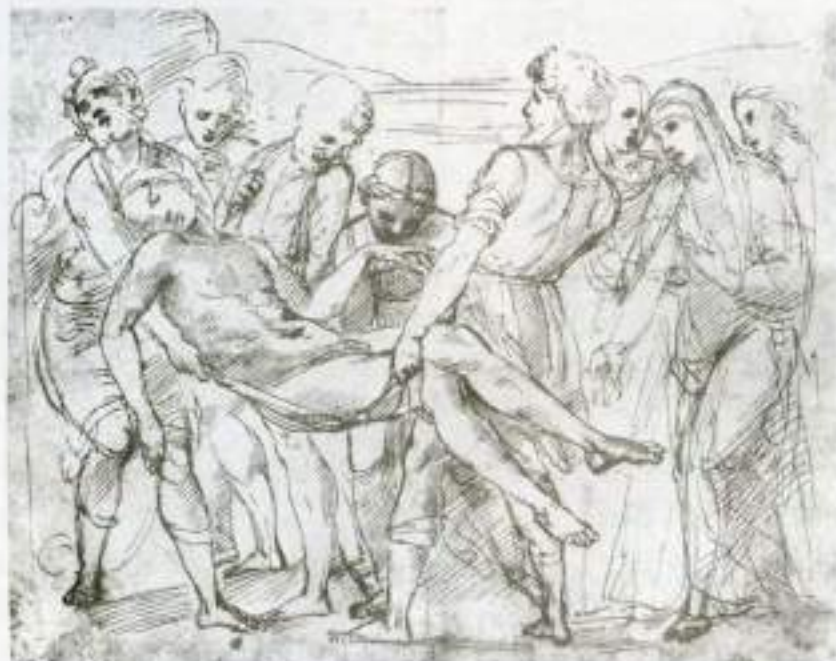
Εικόνα 27. - Ρεφρέσιλ Σχέδιο για την "Ταφή του Χριστού".

Στη συμμετρική ισορροπία οι ισοβαρείς όγκοι μοιράζονται σε ίση απόσταση από τον κεντρικό άξονα του πλαισίου, κατακόρυφο ή οριζόντιο. Όπως συμβαίνει στην κλασική ζυγαριά, στην οποία ο κατακόρυφος άξονας είναι στη μέση. Αυτή είναι μια πολύ στατική ισορροπία και μονότονη, όπως ακριβώς αναφέραμε και στη χάραξη του χώρου. Επειδή ρίχνει το μεγαλύτερο βάρος στο κέντρο και δίνει την αίσθηση της ανάτασης, χρησιμοποιείται συχνά σε θέματα θρησκευτικά. (Εικόνες 27 και 28)