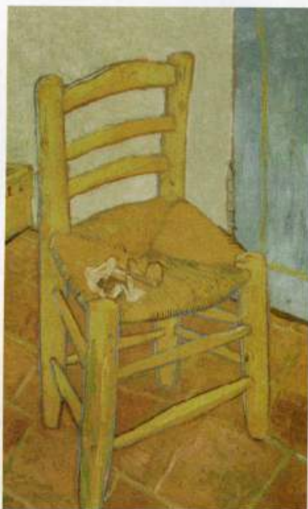
Εικόνα 26β. - Β. Βαν Γκογκ, "Η καρέκλα του Βίνοντ", λεπτομέρεια

Αυτές είναι κάποιες κλασικές ενδεικτικές τοποθετήσεις. Μπορούν να προταθούν ή να ανακαλυφθούν και άλλες, οι οποίες εξαρτώνται από τις ισορροπίες οπτικών "βαρών" που θέλουμε να επιτύχουμε. Λέγοντας οπτικά βάρη εννοούμε το χώρο που καταλαμβάνει η μάζα των αντικειμένων, καθώς και τη δύναμη του όγκου και του χρώματός τους.